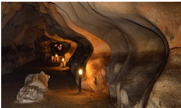
Пещера „Орлова чука“

После – напред към Дунава! Първата ни спирка ще е за още една пещера, Орлова чука , която със своите 13,5 км е втората по дължина пещера в България. Ще обходим облагородената част от нея – там са открити останки от праисторически животни и хора.