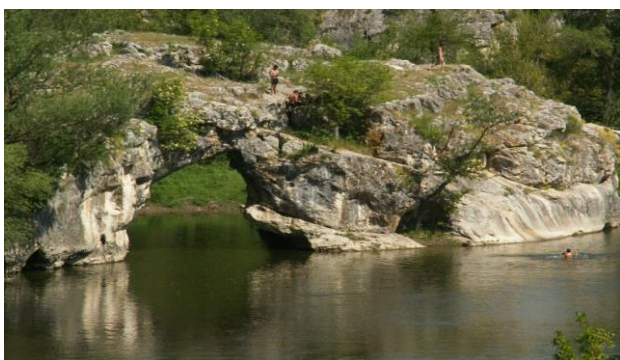
Скална арка, с. Ъглен

Тръгване в 07:27 ч от нашето си място, паркинга пред стадион „Васил Левски“. Потегляме в посока Велико Търново. По пътя първата ни спирка ще бъде в покрайнините на с. Ъглен, за да видим скалния феномер „Дупката“.