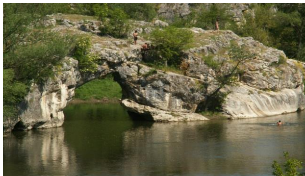
Скална арка, с. Ъглен

Тръгване в 07:27 ч от нашето си място, паркинга пред стадион „Васил Левски“. Потегляме в посока Велико Търново. По пътя първата ни спирка ще бъде в покрайнините на с. Ъглен, за да видим скалния феномер „Дупката“.