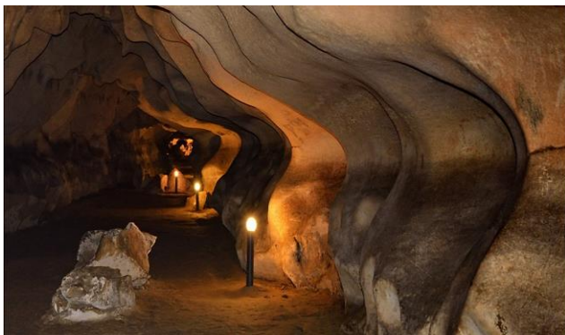
Пещера „Орлова чука“

После – напред към Дунава! Първата ни спирка ще е за още една пещера, Орлова чука , която със своите 13,5 км е втората по дължина пещера в България. Ще обходим облагородената част от нея – там са открити останки от праисторически животни и хора.